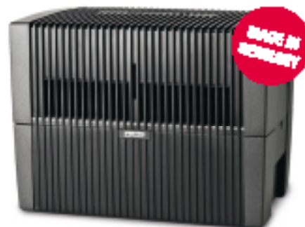
ab € 189,- (UVP)

Erhältlich im Elektrofachhandel ☎ 01-950 17 00-13 • Fax: -03 www.venta-luftwaescher.at