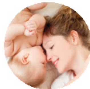
KOMME LUFT FÜR BABY